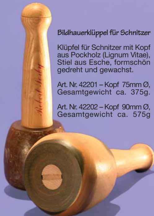
Bildhauerklüppel für Schnitzer

Gewicht: ca. 4,3 kg, Abmessung: Fuß 100mm Ø, Höhe: 260mm.